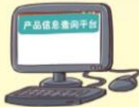
产品信息查询平台